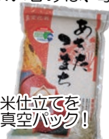
精米仕立てを真空パック！

「はらいっぺ食べてけれ～」毎年大好評のキャンペーンが始まりました。天日干して、米本来の旨味と程よい甘みは、毎日食べても食へ飽きません。また、お好みの精米白度 (玄米・5分・7分・白米) が選べ、組合せは自由です！ 12 年連続で特裁米認定されたお米はご贈答にも喜ばれます。