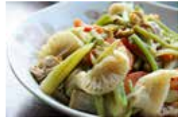
ホタテと山菜、寒干しの煮込み

定番の煮込み料理のほか、戻した大根で漬け物、サラダ、和え物、麻婆豆腐など様々なレシピがインターネットに公開されています。